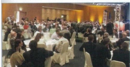
□ Zaplněný sál hotelu Movenpick v Munsteru po prvním chodu galavečeře při prezentaci hovězích partií